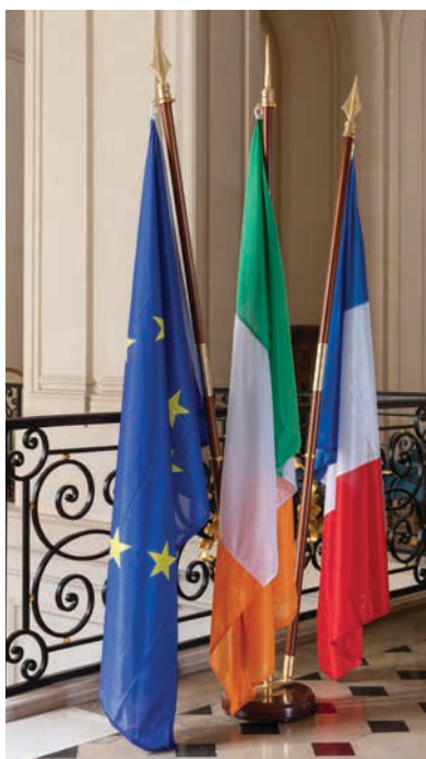
Drapeaux de l'UE, de l'Irlande et de la France à l'ambassade d'Irlande à Paris

Alors que nous célébrons le 50 ème anniversaire de la visite du Général de Gaulle et que l'Irlande s'efforce de doubler son impact mondial, il est temps de réexaminer nos relations avec la France et d'explorer ce que nous pouvons faire de plus dans l'esprit et dans l'action.