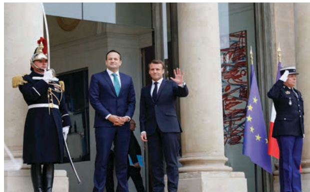
Le Taoiseach Leo Varadkar rencontre le Président Emmanuel Macron à Paris, avril 2019.