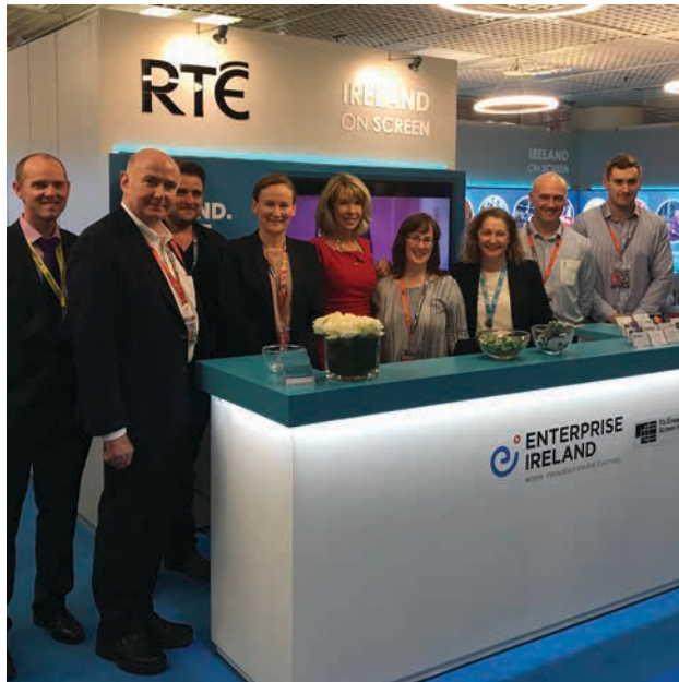
Promotion de la création visuelle irlandaise au Salon de la Télévision MIPCOM, Cannes, 16 octobre 2018.