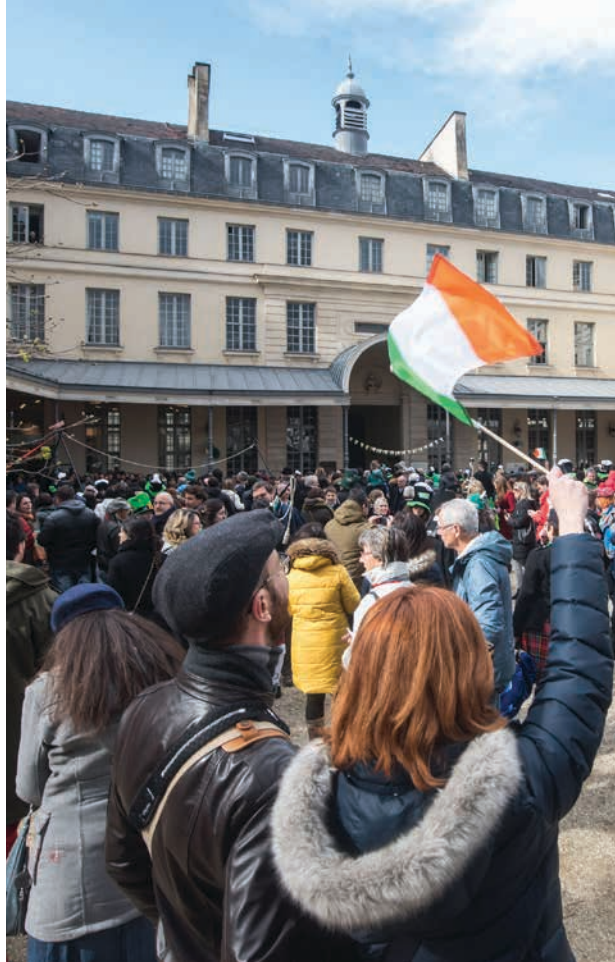
La St. Patrick au Centre Culturel Irlandais, 2019.