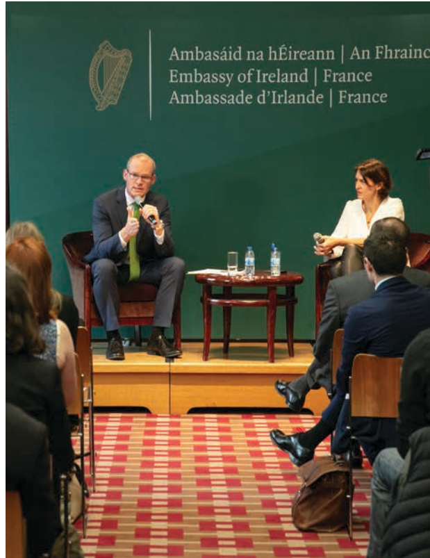
Le Tánaiste (Vice-Premier ministre) Simon Coveney s'exprimant sur « Le Brexit, l'Irlande et l'Europe à 27 », à Paris, le 15 mars 2019.