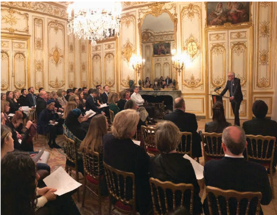
Seachtain na Gaeilge à l'ambassade d'Irlande, Paris, 1er mars 2018.

Nous allons étendre notre réseau de consuls honoraires.