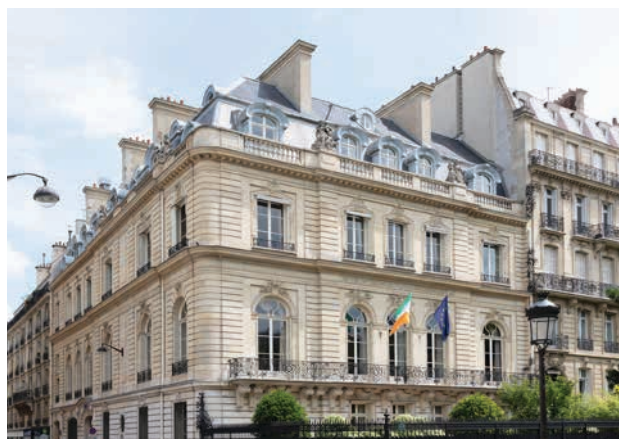
L'ambassade d'Irlande, Paris.