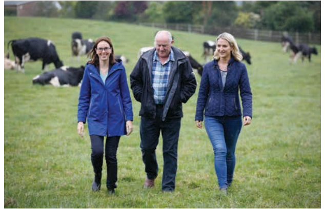
Helen McEntee, Secrétaire d'état chargée des affaires européennes et son homologue en France, Amélie de Montchalin, lors de la visite d'une ferme familiale en Irlande, juillet 2019.

Plus de 400 entreprises irlandaises sont actives sur le marché français, et plus de 23 000 personnes sont employées dans des sociétés détenues par des Irlandais en France. Le réseau d'affaires franco-irlandais NetworkIreland compte 90 membres et soutient les liens entre les entreprises travaillant en étroite collaboration avec la Chambre de Commerce France-Irlande.