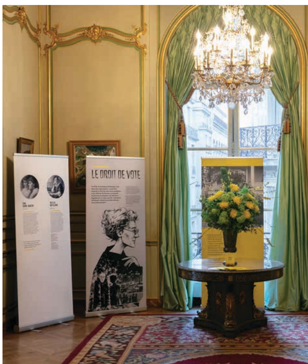
Exposition « Blazing A Trail », Ambassade d'Irlande, Paris, 7 mars 2019.

L'ambassade de France à Paris a tissé des liens étroits et continuent dans ce sens avec les régions et les villes françaises. Elle dispose d'un réseau de consuls honoraires à travers la France : Lyon, Cannes et Cherbourg. Les réformes récentes, en France, ont donné plus de pouvoirs aux régions et la communauté irlandaise est désireuse d'une présence plus forte de notre part en régions.