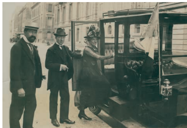
Les envoyés irlandais George Gavan Duffy et Sean T. Ó Ceallaigh avec Mairéad Gavan Duffy partent de la délégation irlandaise au Grand Hotel. Paris, 1919

Au travers de l'Organisation internationale de la Francophonie (OIF), qui a son siège à Paris, la France jouit de liens privilégiés avec 300 millions de francophones à travers le monde. L'Irlande a eu l'honneur de se voir accorder le statut d'Observateur auprès de l'OIF en 2018.