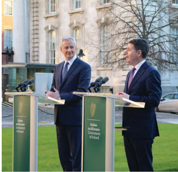
Paschal Donohoe, Ministre des Finances, et son homologue français, Bruno Le Maire, à Dublin, février 2019.