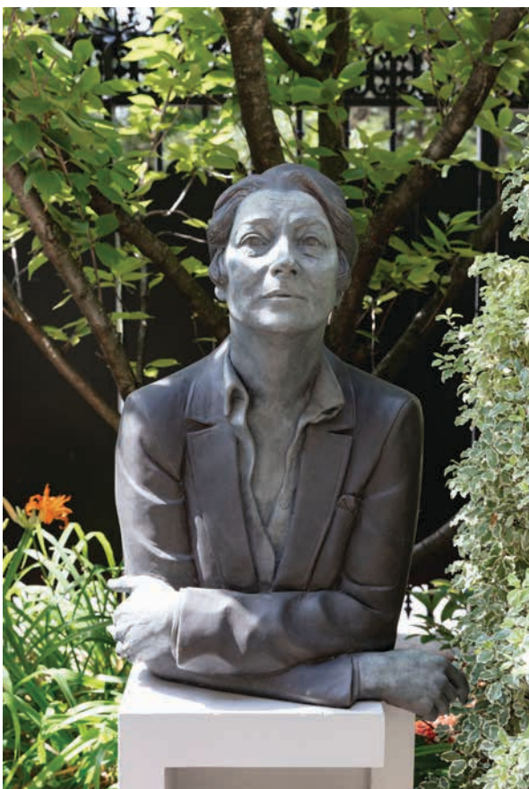
Statue de la célèbre architecte et designer irlandaise Eileen Gray réalisée par Vera Klute, Jardin de l'ambassade d'Irlande, Paris

Pour répondre aux objectifs de Global Ireland et donner un second souffle à nos relations avec la France, l'Irlande a l'ambition de :