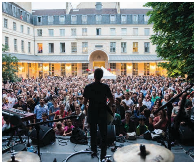
Fête de la musique au Centre Culturel Irlandais, 2019.