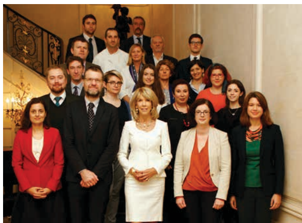
L'équipe de l'ambassade d'Irlande, Paris.